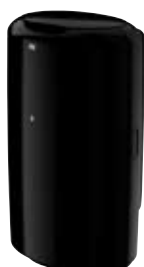
Hulladékgyűjtő tetővel (B1)