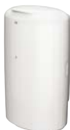
Hulladékgyűjtő tetővel (B1)