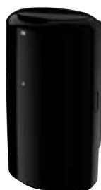
Hulladékgyűjtő tetővel (B1)