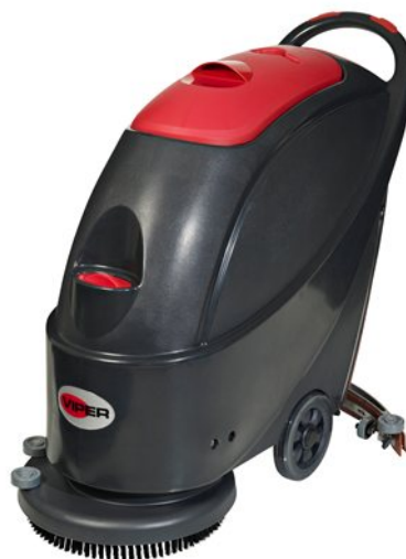
A kép illusztrációként szolgál.

Az AS430/510 könnyen használható, közepes méretű, gyalogkíséretű padlótisztító automaták. Alkalmos szűk helyek tisztítására. Mindenütt kiválóan alkalmazható, ahol közepes méretű területet kell napi szinten takarítani: hotelek, éttermek, iskolák, üzletközpontok, egyéb kiskereskedelmi egységek, kórházak, metró-és vasútállomások, stb.